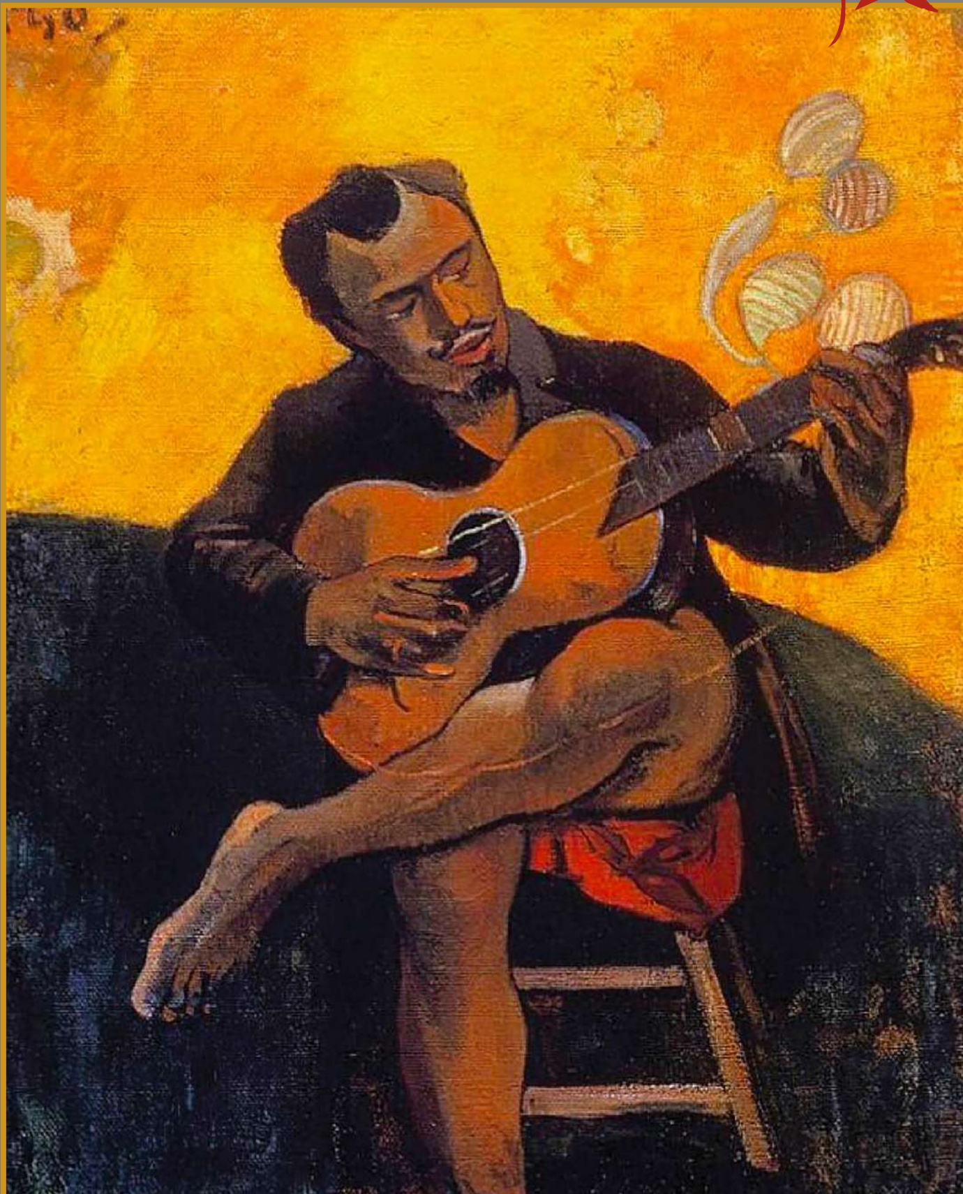
Paul Gauguin 1894 «The guitar player»